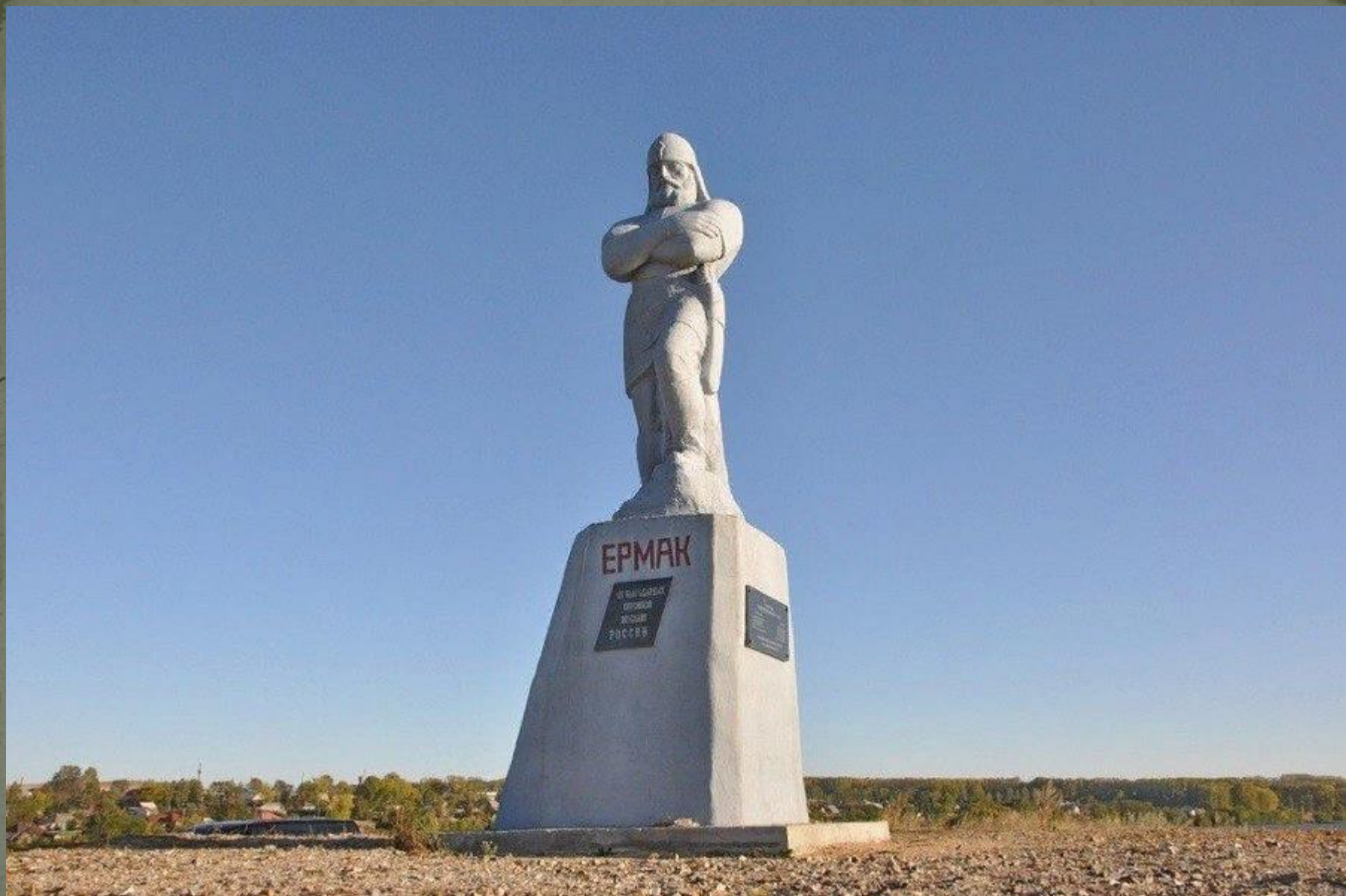
Памятник Ермаку на Нагорном пруду.