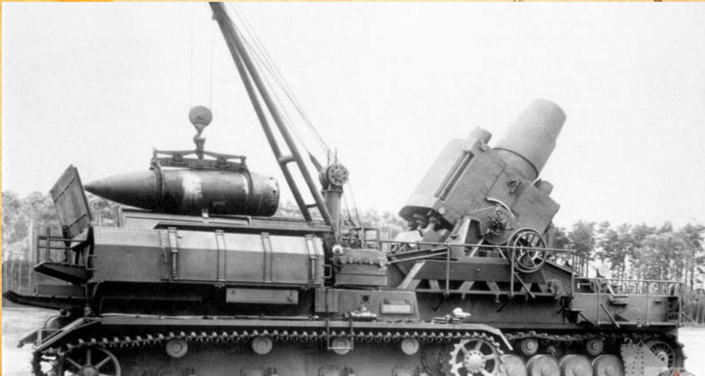
600-мм самоходная мортира «Карл» (Karl Gerät 040)