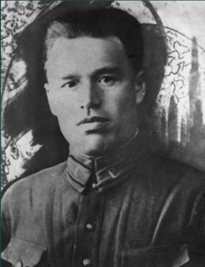
Пётр Михайлович Гаврилов ( 1900 — 1979 )

Фашисты думали, что этот неожиданный удар принесет им легкую победу и они быстро захватят крепость. Но когда гитлеровские солдаты ворвались во двор крепости, их встретил огонь из пулеметов и винтовок. Атака была отбита. Наши воины, оставшиеся в живых, взялись за оружие. Ими командовал майор Петр Гаврилов, капитан Иван Зубачев, полковой комиссар Ефим Фомин и другие.